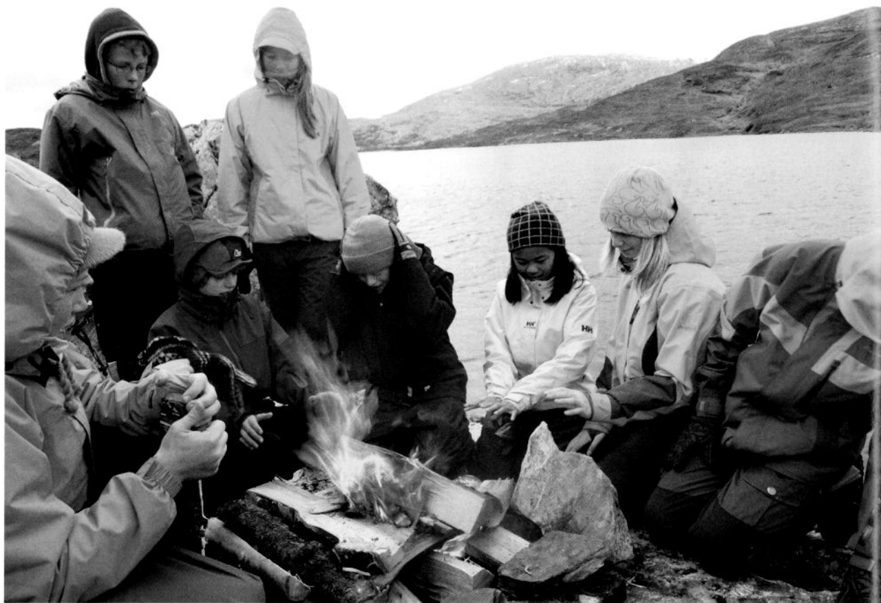
Bålvarme gjør godt for oktoberkalde fingre, som nettopp har halt i land dagens fangst fra Søyevatnet: 15 magre ørreter.